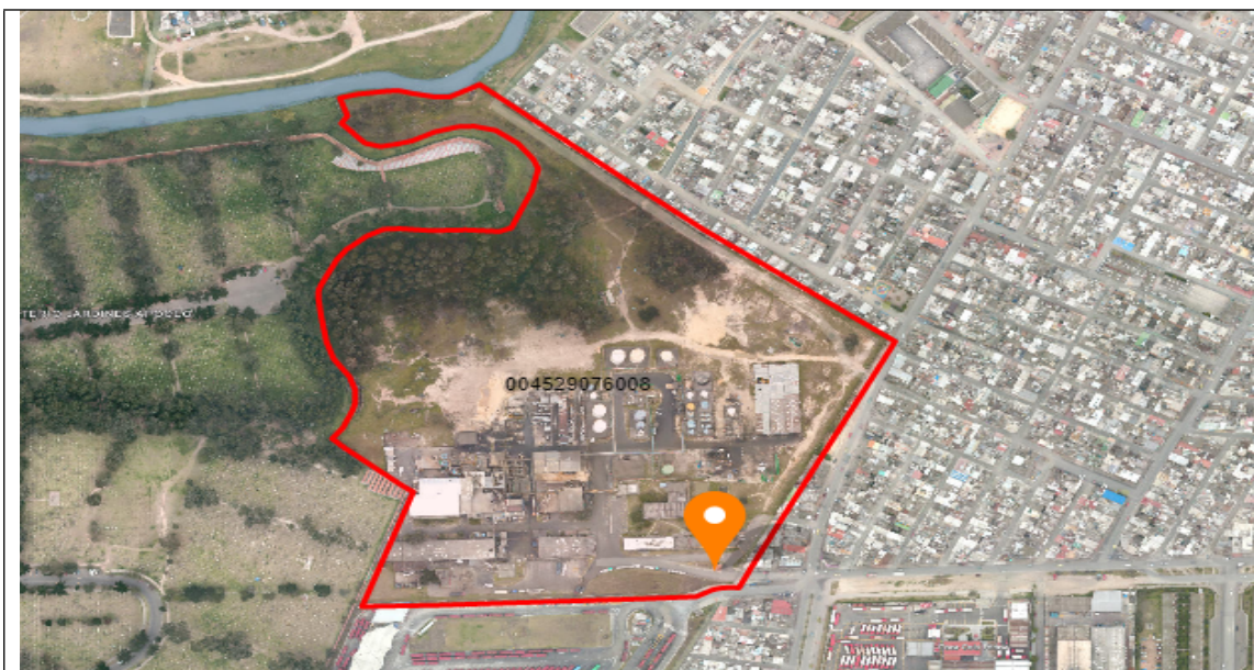
Imagen No. 1. Ubicación del pozo pz-07-0004

A continuación, se presenta la ubicación del pozo pz-07-0004.